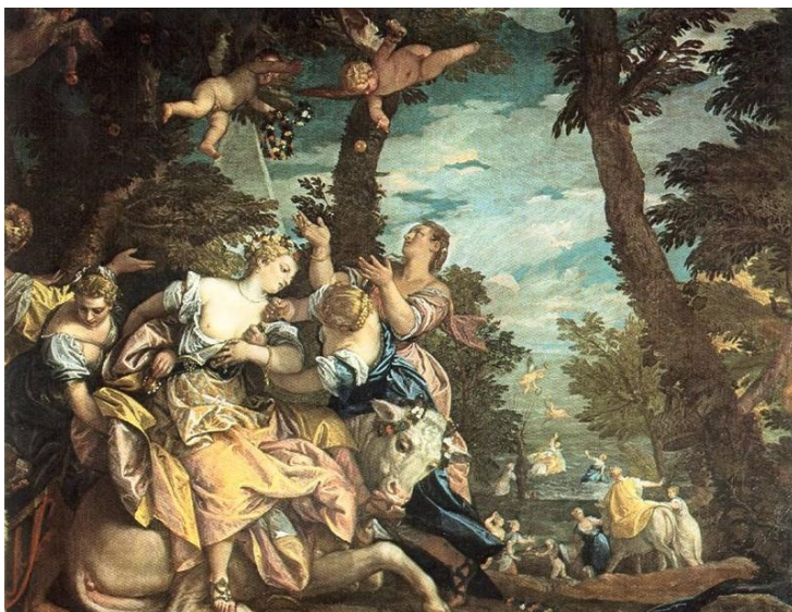
Paul Véronèse, L'enlèvement d'Europe , 1580 (huile sur toile, 240 x 303 cm)