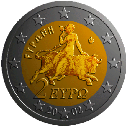
Pièce de 2 € grecque