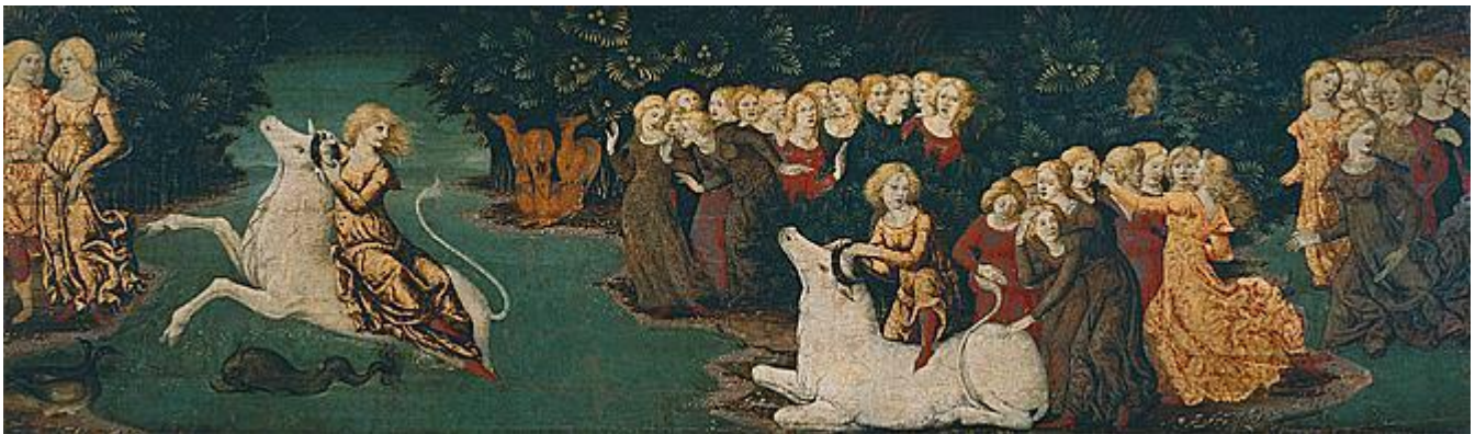
Liberale Da Verona, L'enlèvement d'Europe, 1599 Panneau - 39 cm x 118 cm - Paris, musée du Louvre