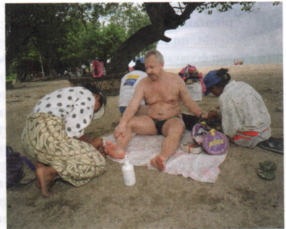
Martin Parr, Indonésie, Bali, Kuta, 1993.

1. Présentez dans le tableau ce que montrent explicitement les deux photographies.